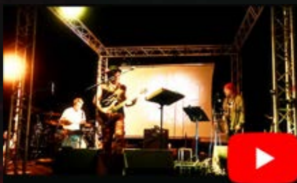
Live 'Raj did not save the Queen' RondaTiRoule

"Une composition électro-rock aux sonorités orientales dotées de qualités hypnotiques et légèrement psychédéliques. La stimulante polyrythmie de ce morceau instrumental hautement évolutif captive l'attention dès les premières mesures. Une sensualité empreinte de mystère entoure cette création musicale qui rappelle à la fois Ramasutra, Niyaz, Nils Petter Molvaer et les Chemical Brothers. Cet amalgame d'influences et de sonorités d'une grande musicalité devrait ravir les épicuriens !"